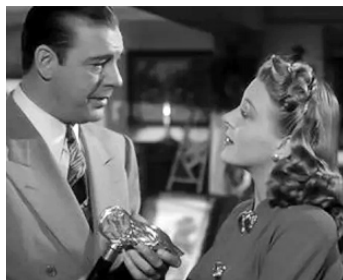
1941 LE LOUP-GAROU (The Wolf Man) de George Waggner avec Evelyn Ankers