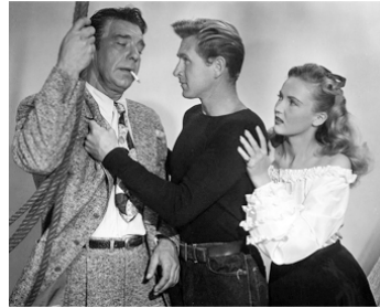
1948 RÉCIFS DE FLORIDE (6 Fathoms Deep) d'I. Allen avec Lloyd Bridges, Tanis Chandler