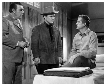
1965 QUAND PARLE LA POUDRE (Town Tamer) de L. Selander avec R. Jaekel, Dana Andrews