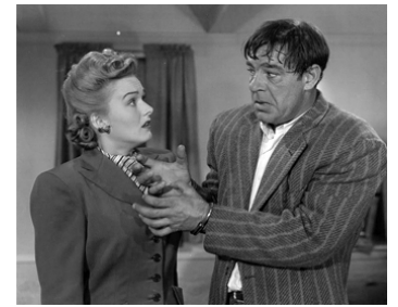
1948 THE COUNTERFEITERS de Sam Newfield avec Doris Merrick