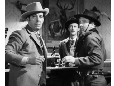
1939 L'AIGLE DES FRONTIÈRES (Frontier Mashal) d'Allan Dwan avec Joe Sawyer