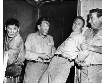
1955 LE PACTE DES TUEURS (Big House, USA) d'H. Koch avec Ch. Bronson, Ralph Meeker