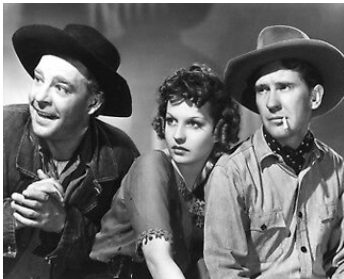
1939 DES SOURIS ET DES HOMMES (Of Mice and Men) de L. Milestone avec B. Field B. Meredith