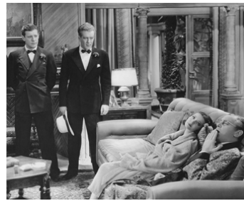
1935 ACCENT ON YOUTH de Wesley Ruggles avec D. Foran, Sylvia Sidney, Herbert Marshall