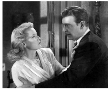
1945 PILLOW OF DEATH de Wallace Fox avec Brenda Joyce