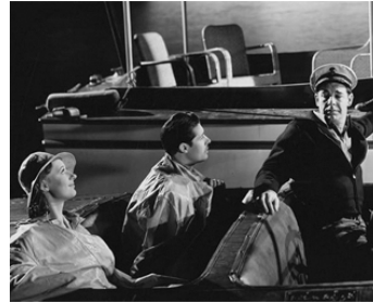
1938 JOSETTE ET COMPAGNIE (Josette) d'Allan Dwan avec Joan Davis, Robert Lowery