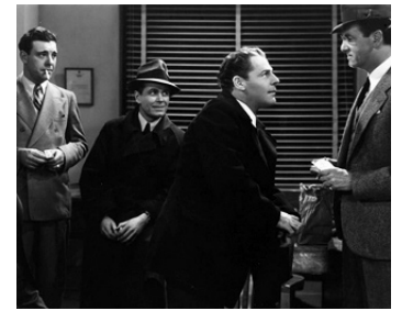
1937 UN TAXI DANS LA NUIT (Midnight Taxi) d'E. Forde avec R. Toomey, Brian Donlevy