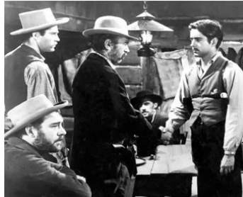
1939 LE BRIGAND BIEN-AIMÉ (Jesse James) d'H. King avec H. Fonda, P. Burns, T. Power