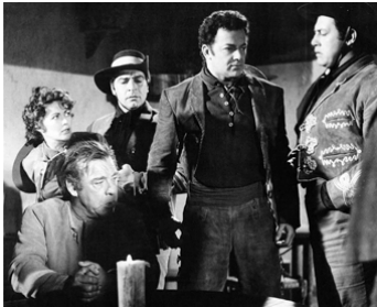
1954 TORNADE (Passion) d'A. Dwan avec Yvonne De Carlo, Cornel Wilde, Raymond Burr