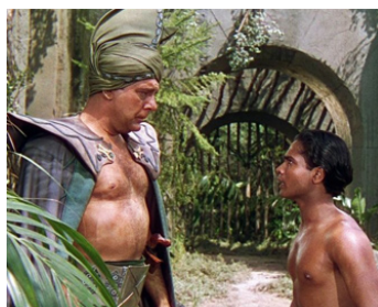
1944 LE SIGNE DU COBRA (Cobra Woman) de Robert Siodmak avec Sabu