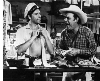
1954 L'APPEL DE L'OR (Jivaro) d'Edward Ludwig avec Fernando Lamas