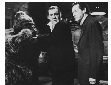
1967 HILLBILLIES IN A HAUNTED HOUSE de Jean Yarbrough avec John Carradine