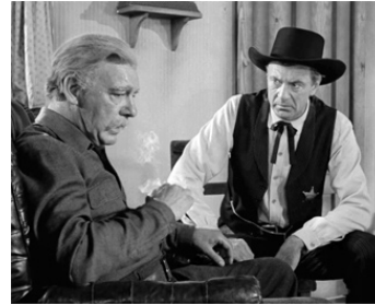
1952 LE TRAIN SIFFLERA TROIS FOIS (High Noon) de Fred Zinnemann avec Gary Cooper