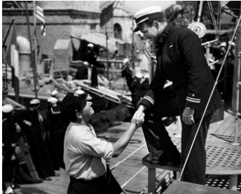
1938 PATROUILLE EN MER (Submarine Patrol) de John Ford avec Preston Foster