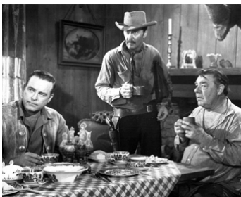
1964 LA DILLIGENCE PARTIRA À L'AUBE de W. Claxton avec Scott Brady, Barry Sullivan