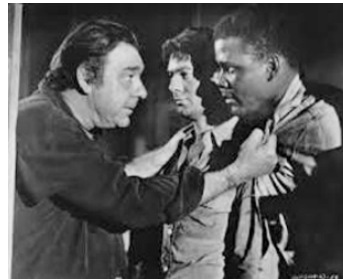
1958 LA CHAÎNE (The Defiant Ones) de Stanley Kramer avec Tony Curtis, Sidney Poitier