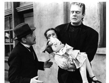
1942 LE SPECTRE DE FRANKENSTEIN (The Ghost of Frankenstein) d'Erle C. Kenton