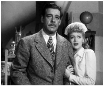
1945 LA MAISON DE DRACULA (House of Dracula) d'Erle C. Kenton avec Martha O'Driscoll