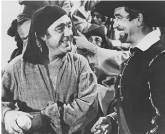
1953 LE PIRATE DES 7 MERS (Raiders of the seven seas) de Sidney Salkow avec John Payne