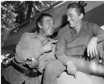
1955 LA RIVIÈRE DE NOS AMOURS (The Indian Fighter) d'André De Toth avec Kirk Douglas