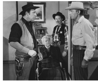
1948 LA DESCENTE TRAGIQUE (Albuquerque) de Ray Enright avec B. Nedell, Randolph Scott