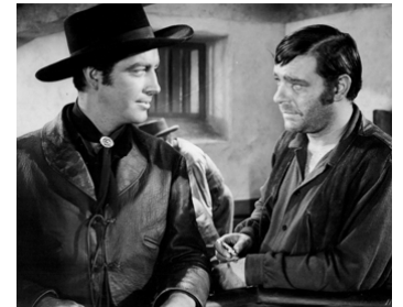
1941 LE RÉFRACTAIRE (Billy the Kid) de David Miller avec Robert Taylor