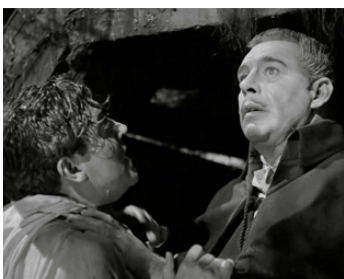
1943 LE FILS DE DRACULA (Son of Dracula) de Robert Siodmak avec Robert Paige