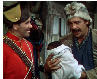
1940 LES TUNIQUES ÉCARLATES (North West Mounted Police) de C. DeMille avec P. Foster