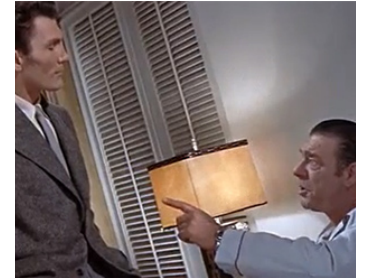
1955 LA PEUR AU VENTRE (I died a thousand times) de Stuart Heisler avec Jack Palance