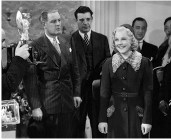
1937 LE PRINCE X (Thin Ice) de Sidney Lanfield avec Sonia Henie