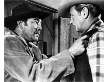
1952 LA MISSION DU COMMANDANT LEX (Springfield Rifle) d'A. De Toth avec G. Cooper