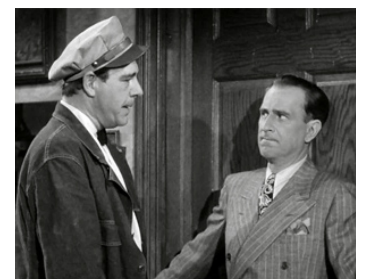
1945 DEUX NIGAUDS AU COLLÈGE (Here come the Co-eds) de Jean Yarbrough avec Bud Abbott