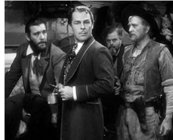
1939 PACIFIC EXPRESS (Union Pacific) de Cecil B. DeMille avec Brian Donlevy