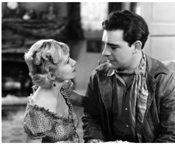
1933 SON OF THE BORDER de Lloyd Nosler avec Julie Hayden