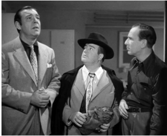
1948 2 NIGAUDS CONTRE FRANKENSTEIN (A. & C. meet Frankenstein) de Ch. Barton