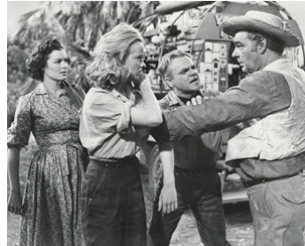
1953 L'HOMME À ABATTRE (A Lion in the Street) de R. Walsh avec B. Hale, A. Francis, J. Cagney