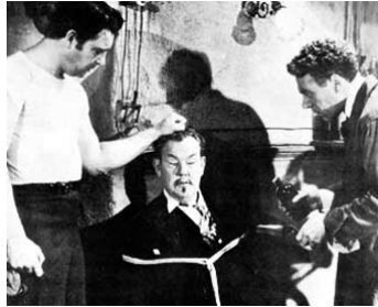
1937 CHARLIE CHAN ON BROADWAY d'Eugene Forde avec Sidney Toler