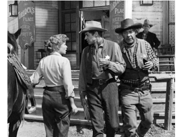
1954 L'HOMME DES PLAINES (The Boy from Oklahoma) de M. Curtiz avec N. Olson, W. Rogers Jr