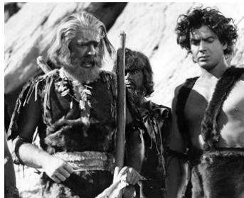
1940 TUMAK, FILS DE LA JUNGLE (One Million B. C.) d'Hal Roach avec Victor Mature