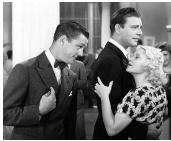
1934 L'IMAGE DE SES RÊVES (Girl o'my Dreams) de R. McCarey avec E. Nugent, Mary Carlisle